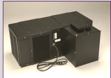
System wird mit optional integriertem Luftbefeuchter gezeigt